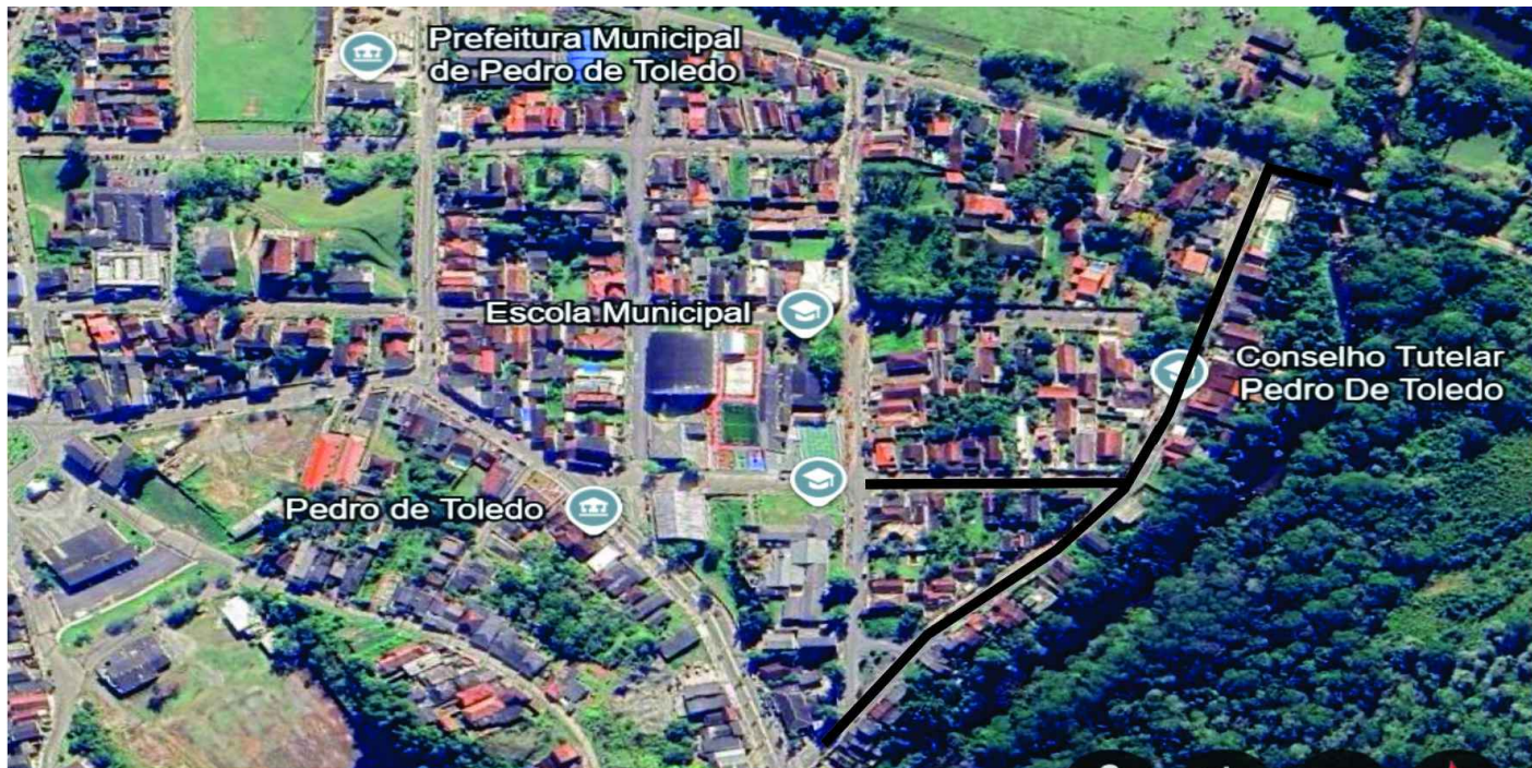
DETALHE DO PERFIL DA RUA RECAPEAMENTO